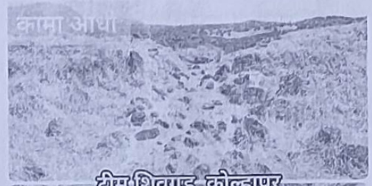
टीम शिवगड, कोल्हापूर