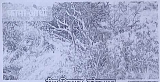
टीम शिवगड, कोल्हापूर

शिवगड मोहीम - साफ सफाई व प्लास्टिक गोळा केले व येण्याची जाण्याची वाट मोकळी केली.